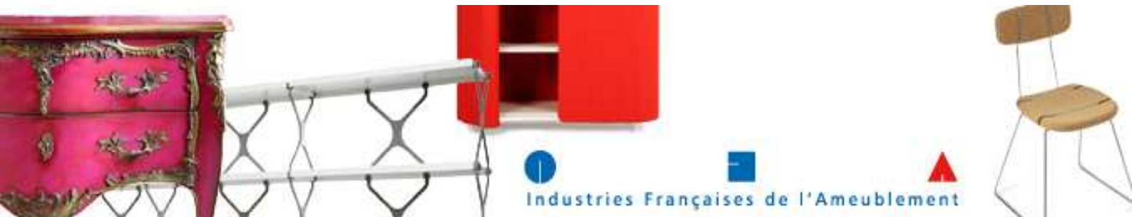
TABLEAU DE BORD 2009