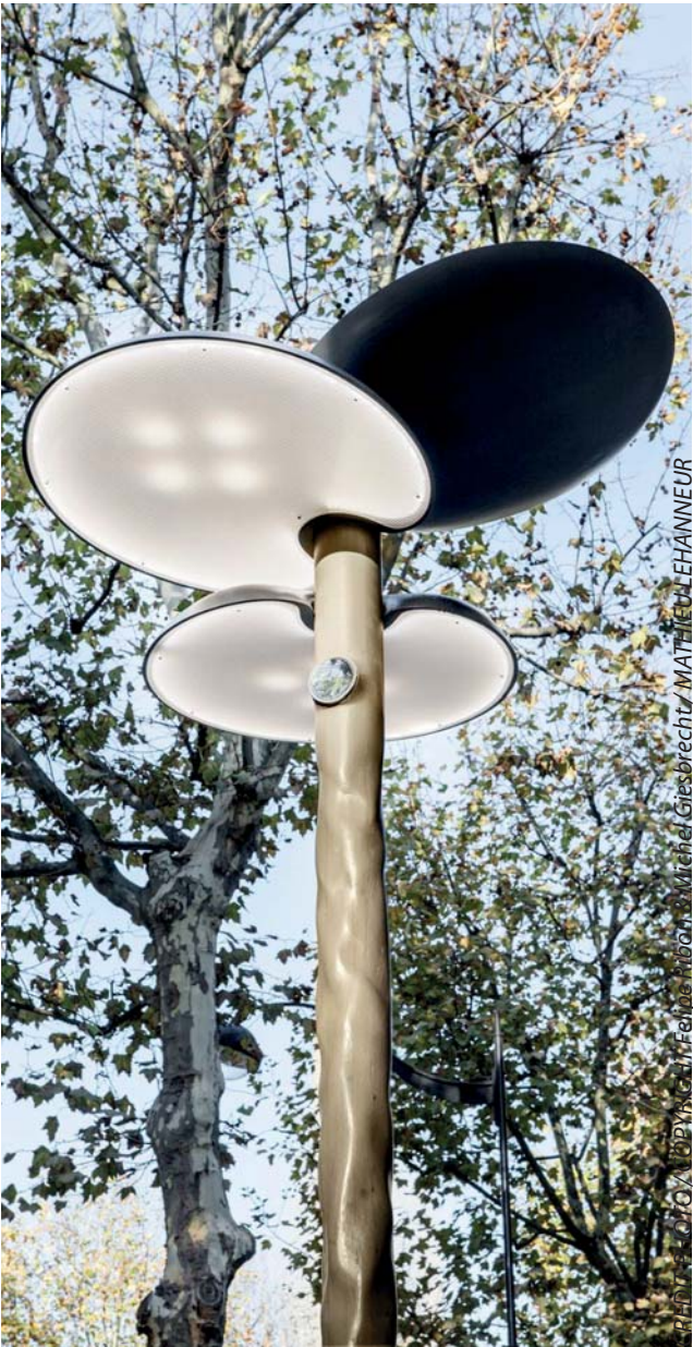
CREDIT PHOTO / COPYRIGHT Felipe Ribon & Michel Giesbrecht / MATHIEU LEHANNÉUR