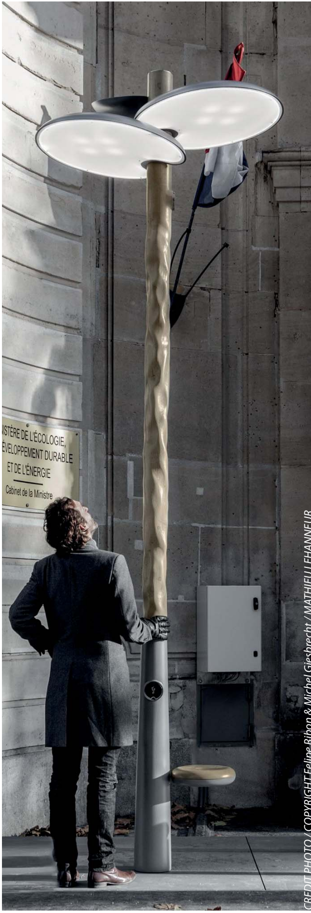
CREDIT PHOTO / COPYRIGHT Felipe Ribon & Michel Giesbrecht / MATHIEU LEHANNÉUR