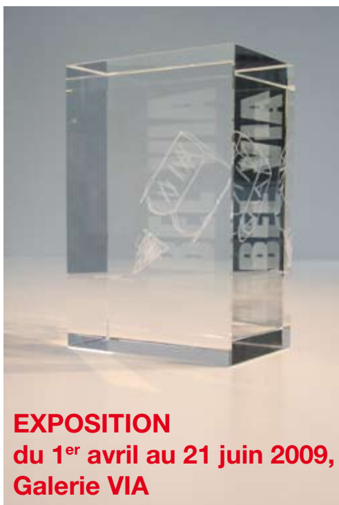
EXPOSITION du 1 er avril au 21 juin 2009, Galerie VIA

Positionnés de l'entrée de gamme au luxe, ces 25 nouveaux Labels arrivent sur le marché avec une carte maîtresse: leur forte valeur ajoutée.